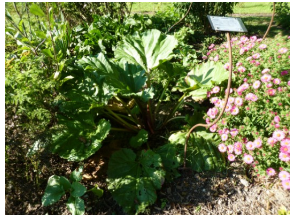
Pied de rhubarbe au moulin des Ayes

Pour éliminer les dépôts calcaire dans une casserole ou une bouilloire, vous pouvez y faire bouillir quelques morceaux de pétioles de rhubarbe coupés dans un peu d'eau.