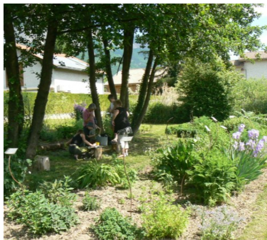
ou faisait visiter le Jardin du Moulin des Ayes.