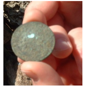
La pièce avant nettoyage