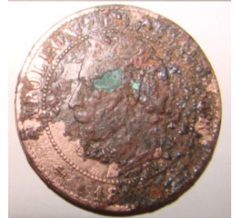
La pièce après décapage