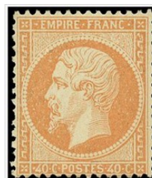
40 centimes orange « Empire » dentelé, effigie de Napoléon

soutien à Maximilien et à l'Autriche est toutefois un échec. Les élections de 1869 sont très mauvaises pour le régime et l'opposition obtient 45 % des voix. Le régime évolue alors vers un Empire parlementaire en appelant Émile Ollivier, chef du parti orléaniste et libéral, au pouvoir. Après Sadowa en 1866 où la Prusse écrasa l'Autriche, l'affaire du trône d'Espagne et de la dépêche d'Ems entraînent la guerre qui fut déclarée le 19 juillet 1870. Accumulant les revers, l'armée française est encerclée dans Metz puis Napoléon III, malade, capitule à Sedan le 2 septembre. Aussitôt la nouvelle connue, la déchéance de l'Empire est annoncée par Gambetta puis la république est proclamée le 4 septembre. Napoléon III est alors emmené en captivité en Hesse puis dans le Kent où il meurt en 1873.