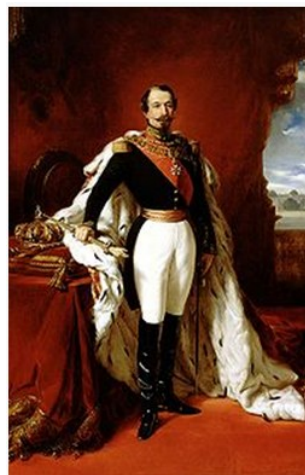
Napoléon III par Franz-Xavier Winterhalter

Proclamé empereur sous le nom de Napoléon III, Louis Napoléon fit son entrée solennelle à Paris le 2 décembre 1852. Il épouse Eugénie Marie de Montijo, aristocrate espagnole en janvier 1853. Son règne peut se diviser en trois périodes : l'Empire autoritaire jusqu'en 1860 ; l'Empire libéral de 1860 à 1870 ; puis l'Empire parlementaire en 1870. Durant l'Empire autoritaire, Napoléon III exerce son pouvoir sans partage, contrôle la presse tandis que les journaux pratiquent l'autocensure pour éviter leur suppression, les préfets exercent une puissance illimitée dans les départements, les maires, les fonctionnaires sont nommés par le gouvernement. Comme sous le Premier Empire, l'Éducation et l'Université sont surveillées. Maintenant les grands principes de la révolution, la souveraineté du peuple perdure grâce à la consultation par plébiscite. Sur le plan économique,